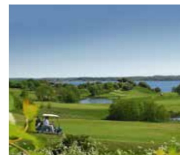
Benniksgaard Golfbane 2 km.