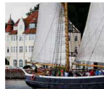
Sønderborg 20 km. Flensborg 22 km