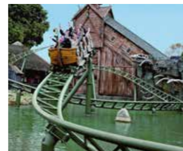
Hansa Park 169 km.