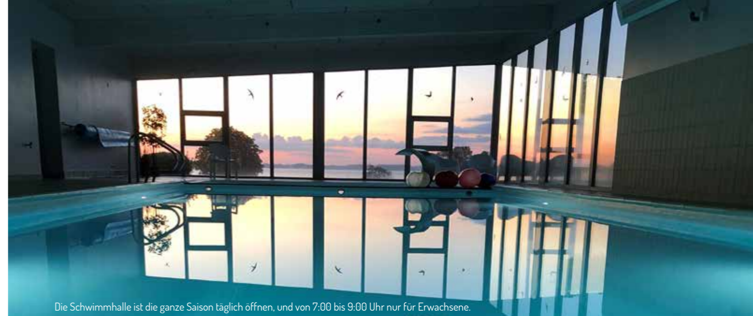
Die Schwimmhalle ist die ganze Saison täglich öffnen, und von 7:00 bis 9:00 Uhr nur für Erwachsene.

Besuchen Sie Laerkelunden auf YouTube, hier können Sie den ganzen Platz von oben sehen. Suchen Sie einfach Laerkelunden Camping.