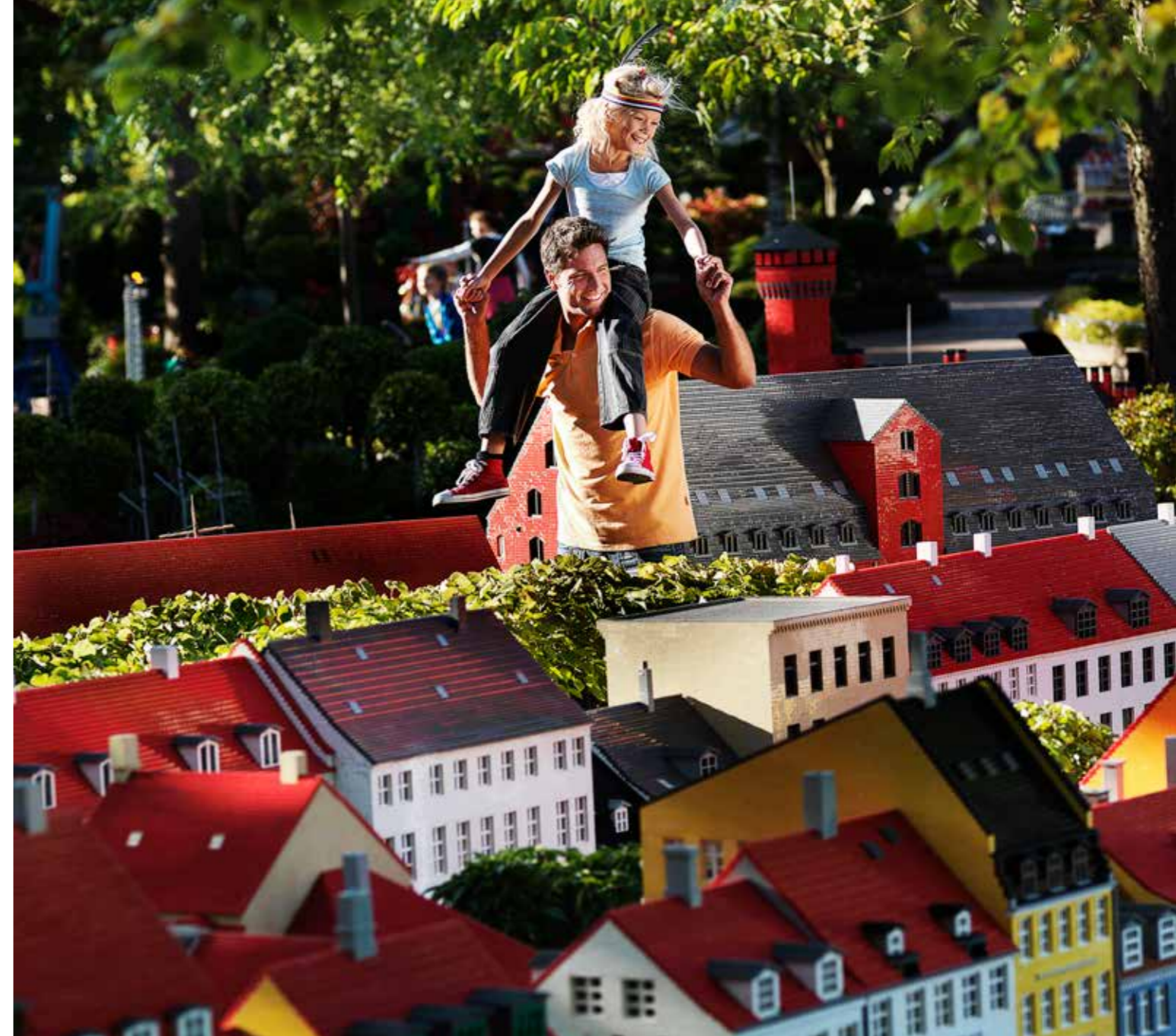
LEGO, the LEGO logo and LEGOLAND are trademarks of the LEGO Group. ©2009, 2015 The LEGO Group.