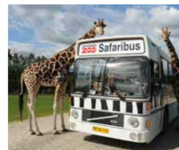
Givskud Zoo 120 km.